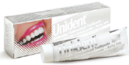
Unident White 100 ml Cena základní 219 Kč s DPH