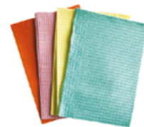
Pacientní roušky 500 ks Cena základní 562 Kč s DPH