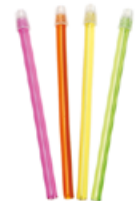
Savek 100 ks Cena základní 85 Kč s DPH