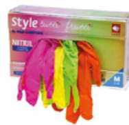
Rukavice XS, S, M, L (zelené, žluté, tmavě růžové, tutti frutti) Cena základní 365 Kč s DPH