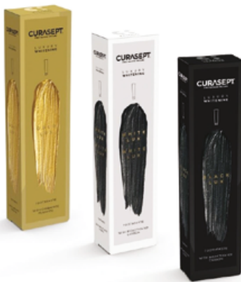
CURASEPT Luxury Gold, White, Black, 75ml Cena základní 316 Kč s DPH