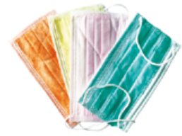
Ústenky (vínová, zelená, fialová, limetková, oranžová, žlutá a růžová) Cena základní 163 Kč s DPH